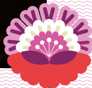
SARA FERNÁNDEZ ESCUER Consejera de Cultura, Educación y Turismo